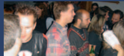
Skelleftebandet Human Flesh rockar loss inför närmare 200 personer.