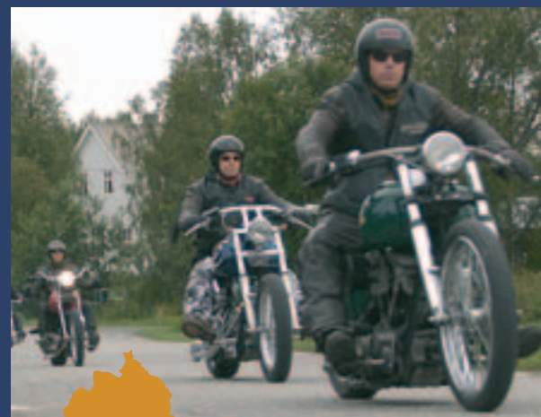
En otäckt gråmulen himmel hotade med oväder precis vid starten. Men inte en droppe föll på hela dagen.

Från Östanbäck körde de via Ostvik, Drängsmark, Stavaträsk, Jörn och till Mejo MC i Svanström, där det blev en fikapaus. Efter att ha surrat, kollat in varandras hojar och ätit av de goda hembakade bullarna och kakorna gick återfärden sedan