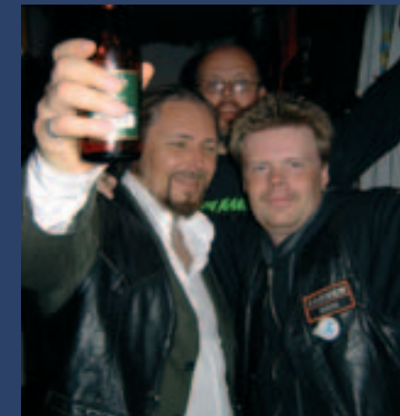
Trötta men glada bikers. Stämningen var på topp trots att dagen blev ganska lång.