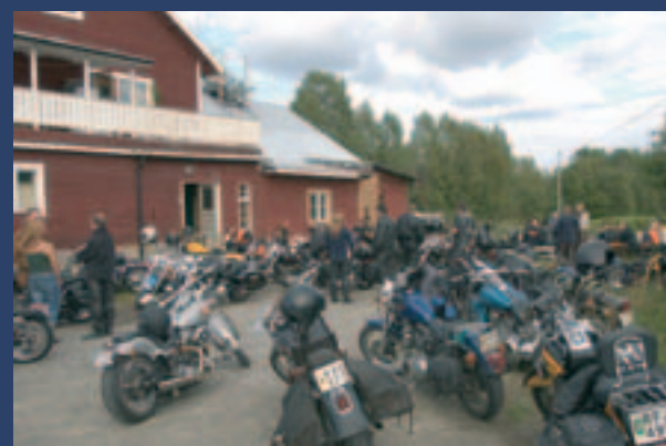
I Svanström blev det fikapaus och nog var det ganska trångt på gården hos Mejo MC.