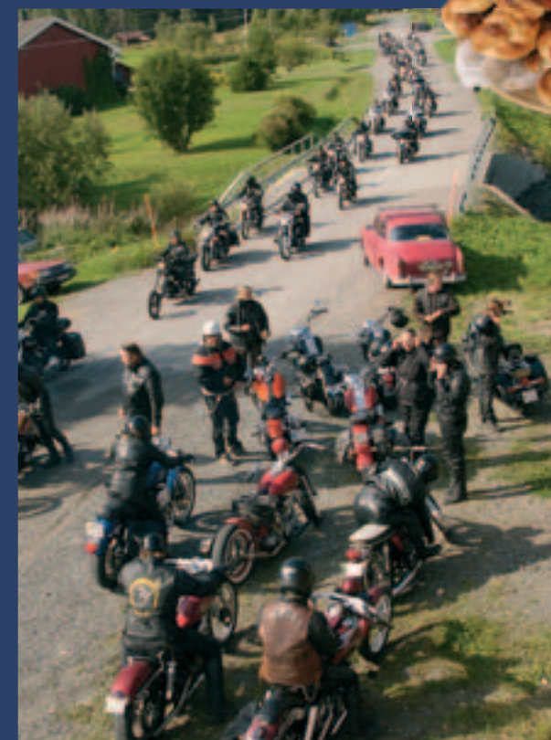
Svanströmsborna gick man ur huse för att kolla när den mullrande massan närmade sig.