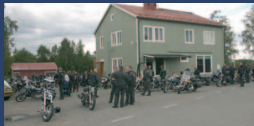
Samling vid den nyrenoverade klubbkåken, totalt blev det drygt 70 hojar som slöt upp för att köra cirka 15 mil i kortege.